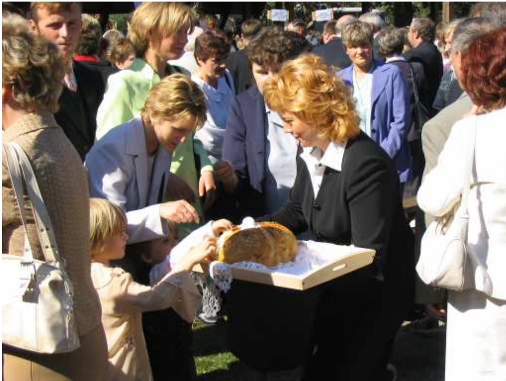
Dożynki Św. Miejsce 2004 r.