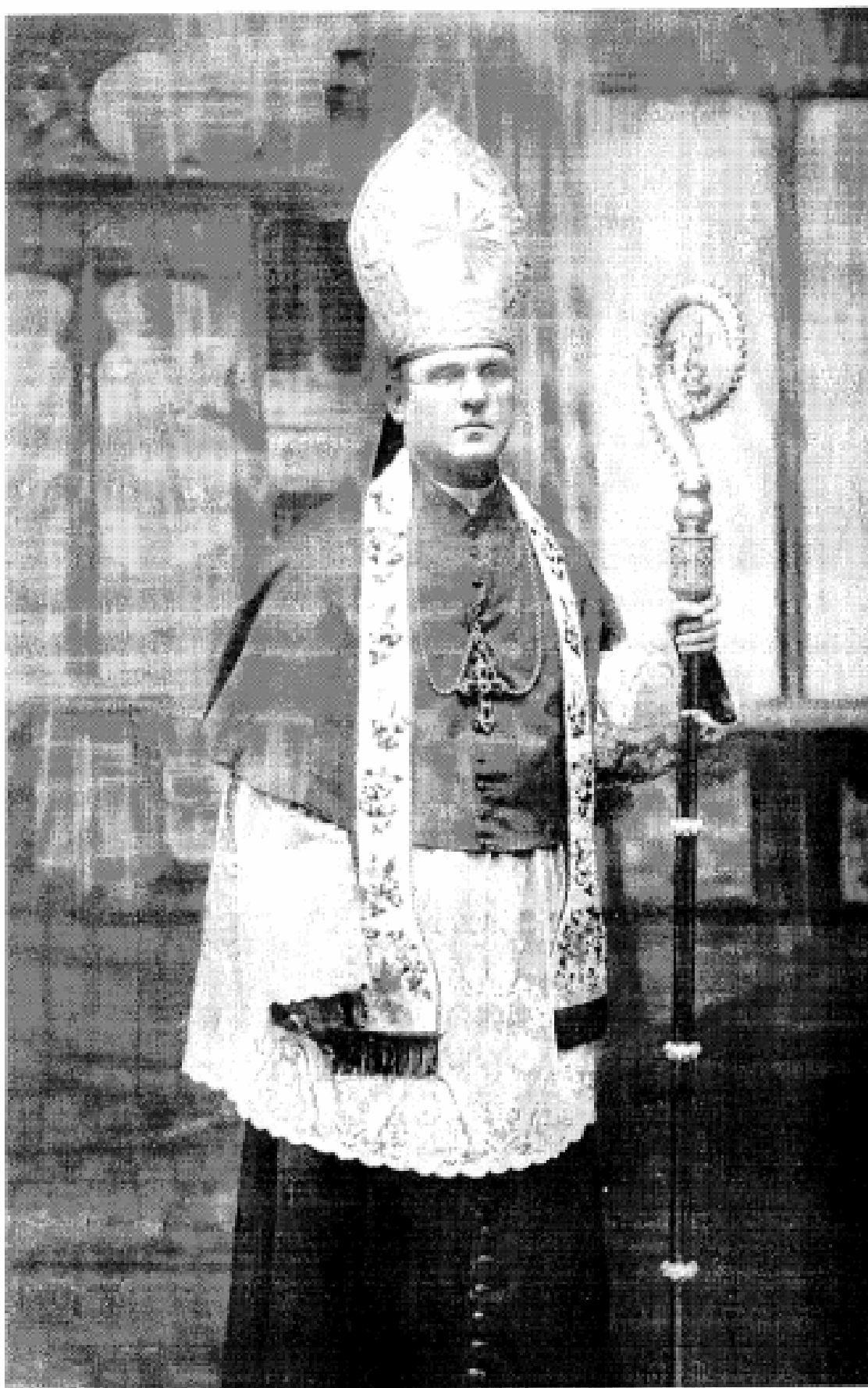
Kardynał Aleksander Kakowski ( 1862 – 1938 ) Prymas Królestwa Polskiego