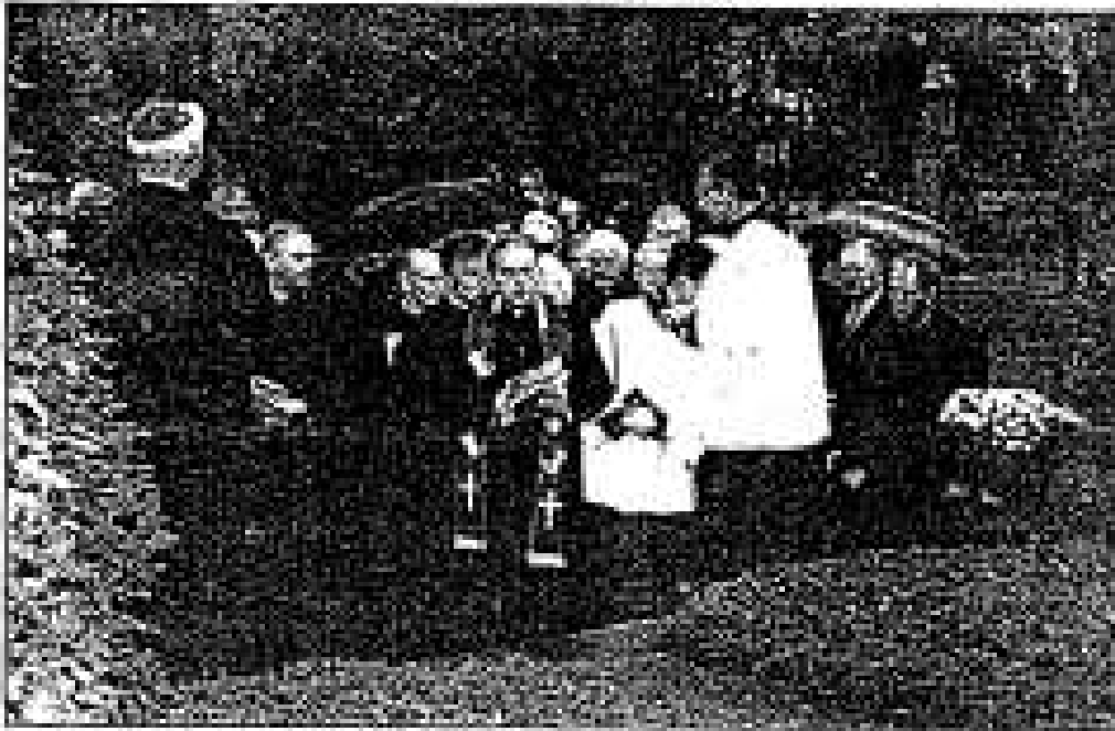
Modlitwa przy grobie kard. Aleksandra Kakowskiego na Cmentarzu Bródnowskim

W 2000 r. nakładem wydawnictwa Platan ukazały się drukiem jego pamiętniki pt. „Z niewoli do niepodległości”, które stanowią ważne źródło historyczne.